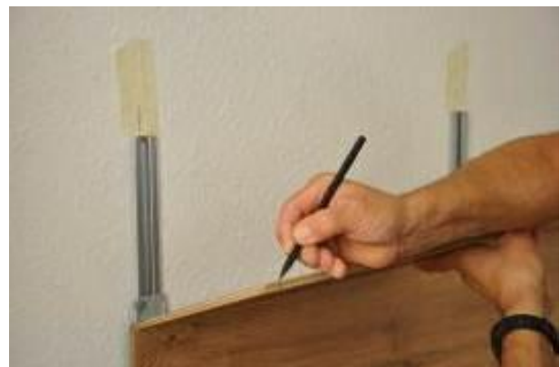
15. b. A 2-es jelölés átvitele