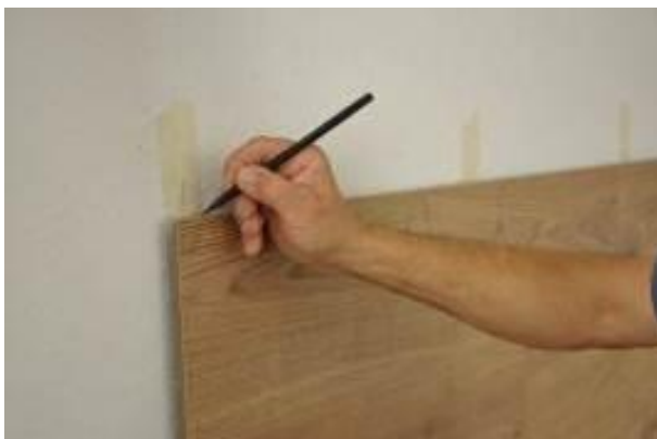
15.a. Az 1-es jelölés átvitele

Figyelem: Az utolsó sor elemeinél a hornyot le kell fűrészelni.