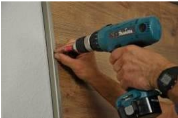
18. Az alumínium takaróprofil felhelyezése