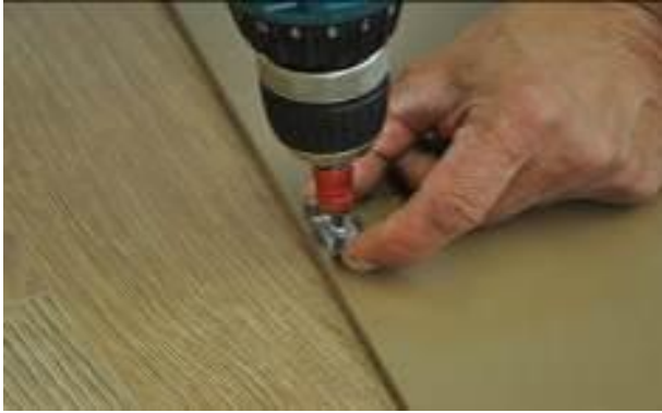
16. A zárókapcsok elhelyezése