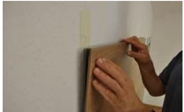
17. Az utolsó lécsor bepattintása