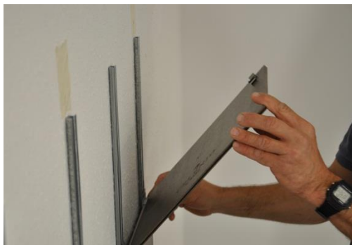
17. Az utolsó lécsor bepattintása