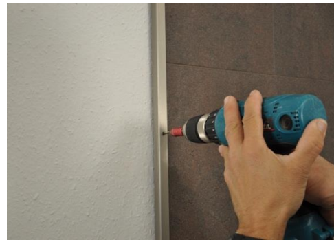
18. A fali elemek oldalsó lefedéséhez szerelje fel a megfelelő HARO zárólécet.