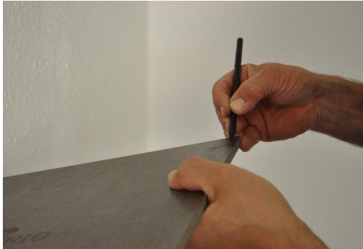
15. b. A 2-es jelölés átvitele