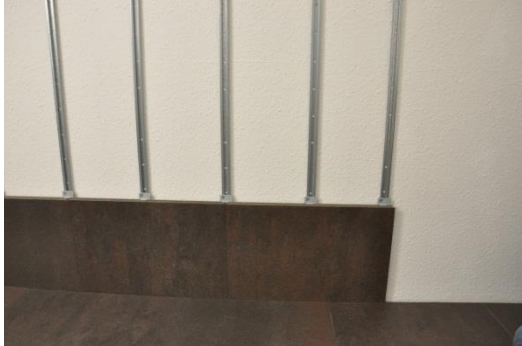
12. Helyezzen minden rögzítősnre rögzítőkapcsot.