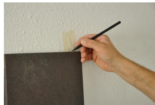
15.a. Az 1-es jelölés átvitele

Figyelem: Az utolsó sor elemeinél a hornyot le kell fűrészelni.