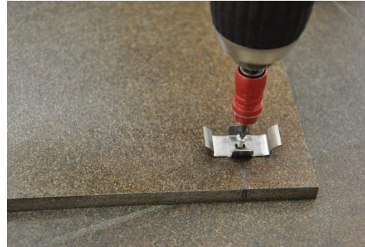
16. A zárókapcsok elhelyezése