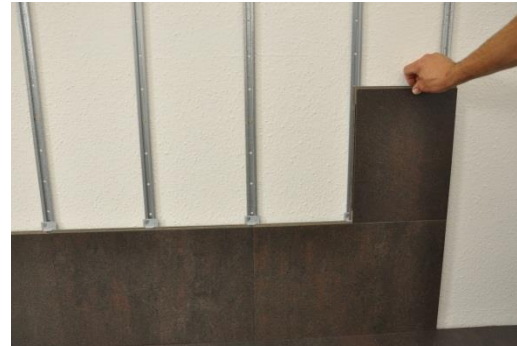
13. Az első sor maradék darabjával (fél elemszélesség) kezdje a következő sort (homlokoldali eltolás = fél elemhossz). A további szerelés elemenként folytatódik tovább jobbról balra.

Hajtsa be szögben a második sor első elemét csappal az előző lemezsor horonyoldalába, és lassan nyomja a lemezt a rögzítősnre. Majd használja ismét a rögzítőkapcsokat az elemek horonyoldali rögzítéséhez. A következő elemet hosszanti irányban befördítjük, majd a homlokoldalon csatlakoztatjuk az előző elemhez. Ezzel az eljárással sorról sorra továbbhaladhat felfelé.