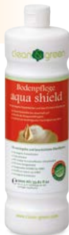
Padlóápolás aqua shield

Gyors, egyszerű, természetes – ápolás minden padlóhoz