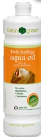
aqua oil parkettaápolás

Nagy igénybevételnek kitett, olajozott, fekete parketta felfrissítéséhez/ felújításához javaslatunk az Aqua Oil Black. Fehér, olajozott parkettához az Aqua Oil White használatát javasoljuk.