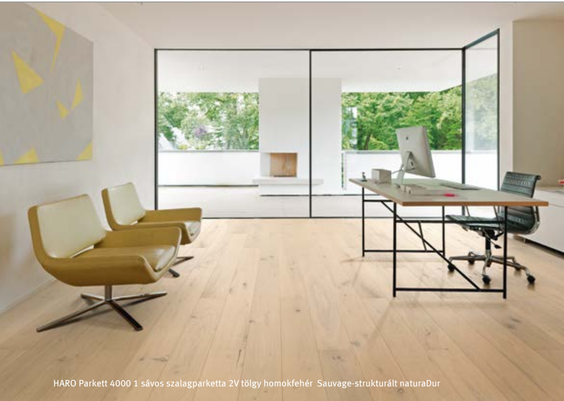
HARO Parkett 4000 1 sávos szalagparketta 2V tölgy homokfehér Sauvage-strukturált naturaDur

Hamberger Flooring GmbH & Co. KG Postfach 10 03 53 83003 Rosenheim Németország