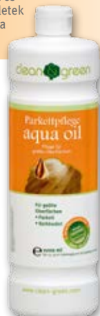
Parkettaápoló aqua oil