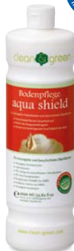
aqua shield padlóápoló lakkozott parkettpadlóhoz és kezelt felületekhez

A clean & green használatával új fényben ragyog a padló. Mindemellett fokozódik a felületek strapabíró képessége és a felülről beható nedvesség elleni védelem.